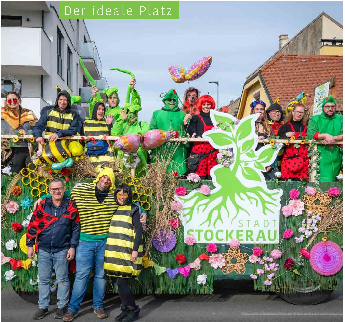
Ein buntes Spektakel für Groß und Klein – am 14. Februar zieht der Faschingszug wieder durch Stockerau.